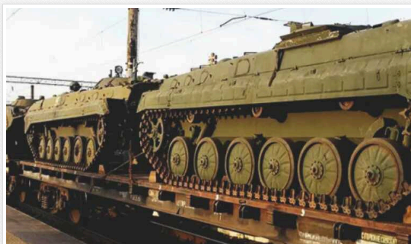
Росіяни «добудували» уявну залізницю на півдні України

Нова залізниця покращить логістику угруповання ЗС РФ, яке утримує південні регіони України. Путін проголосив, що вона вже працює, однак знімки з космосу показують, що до готовності ще далеко.