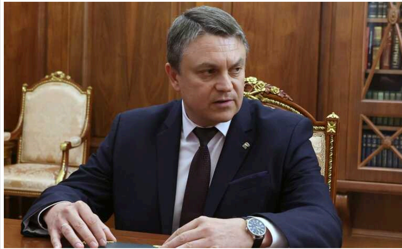
Ватажка «ЛНР» Пасічника судитимуть за проведення псевдовиборів в окупації

Ватажка "ЛНР" Леоніда Пасічника судитимуть в Україні за колабораційну діяльність. Йому загрожує до 10 років в'язниці.