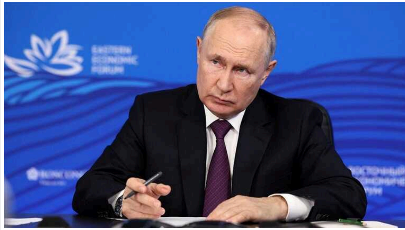
ISW: Путін хоче використати «перемогу» на «виборах» для затяжної війни в Україні

На думку експертів Інституту вивчення війни (ISW), російський диктатор Володимир Путін намагається використати "рекордну перемогу" на президентських "виборах" як передумову для затяжної війни в Україні.