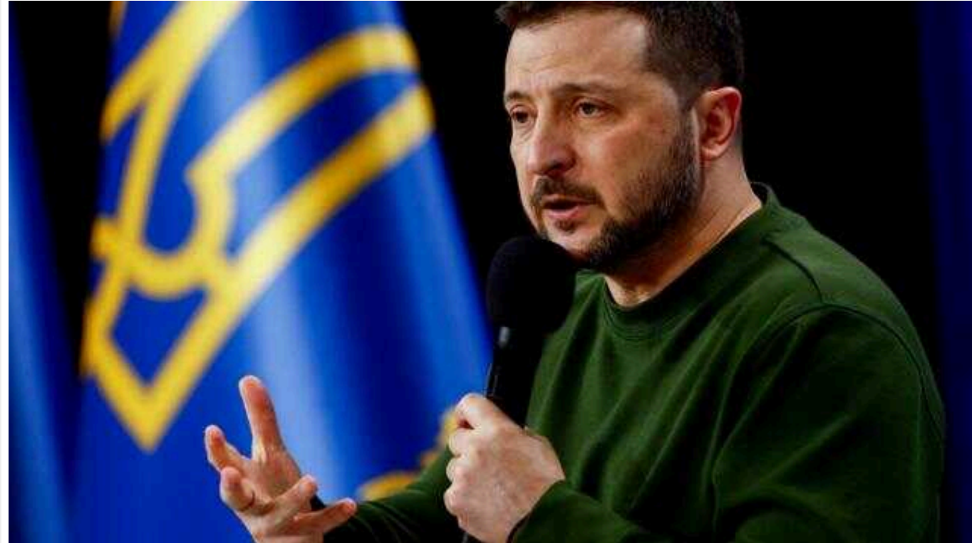
За цей рік ми вийдемо на максимальне українське оборонне виробництво, - Зеленський

Читати на руском Read in English Додати як бажане джерело в Google