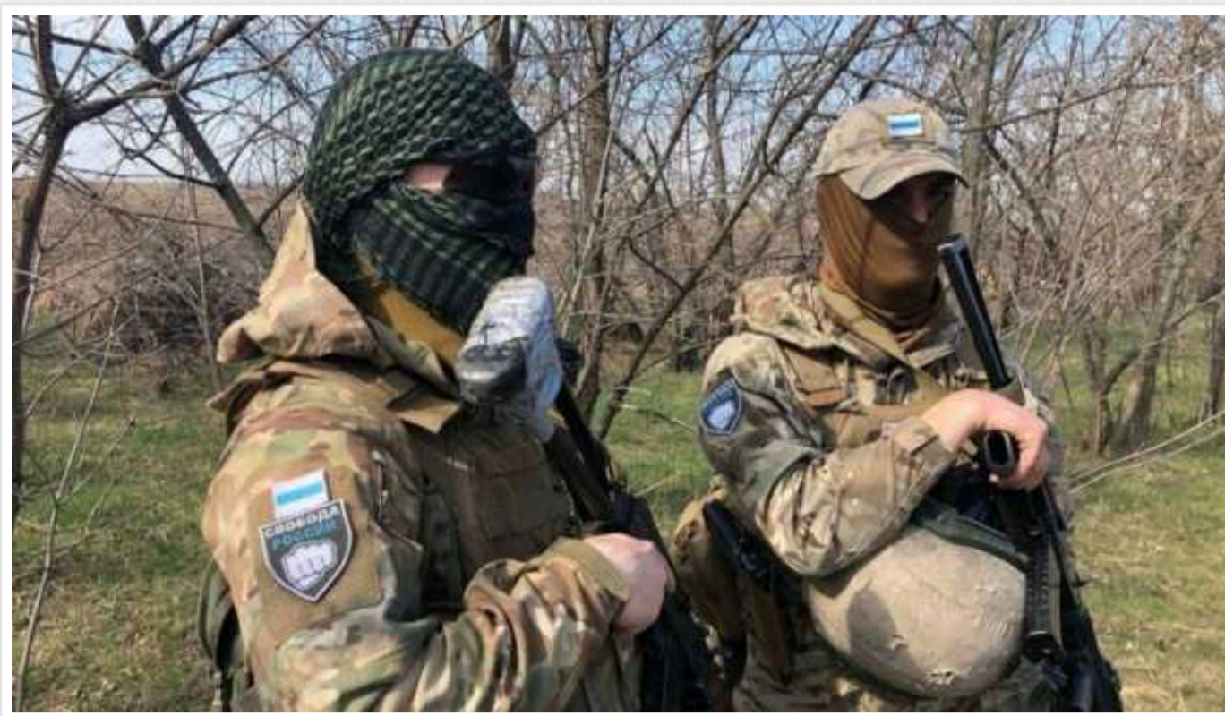
У ЛСР озвучили втрати армії Путіна під час боїв

За тиждень бойових дій на території Белгородської області російська окупаційна армія зазнала великих втрат. Загальна кількість ліквідованих та поранених окупантів становить майже 1500 осіб.