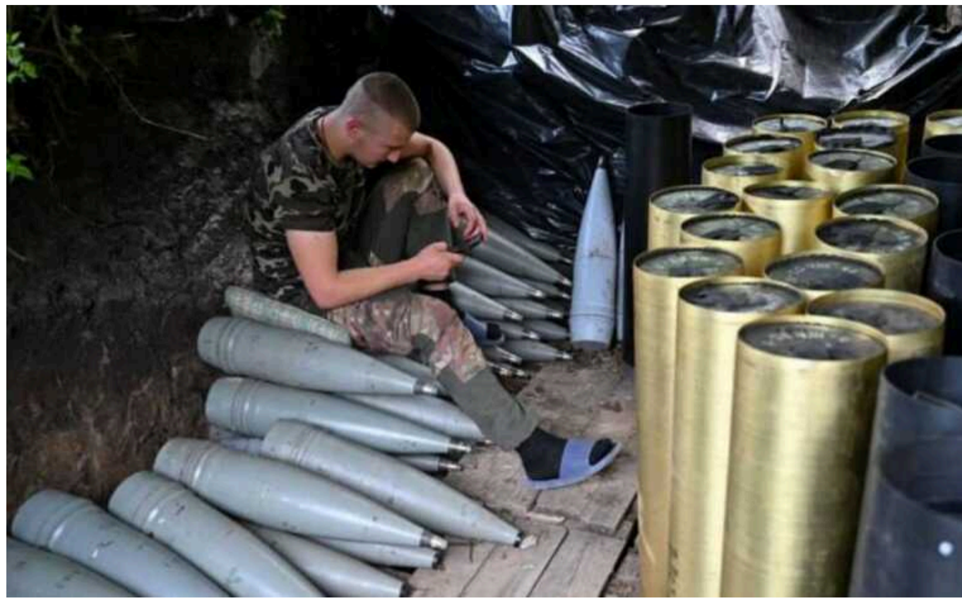
Євросоюз підготував закон, згідно з яким Україна почне отримувати прибуток від заморожених активів РФ вже у липні, - Bloomberg

Гроші підуть на постачання зброї та розвиток оборонної промисловості.