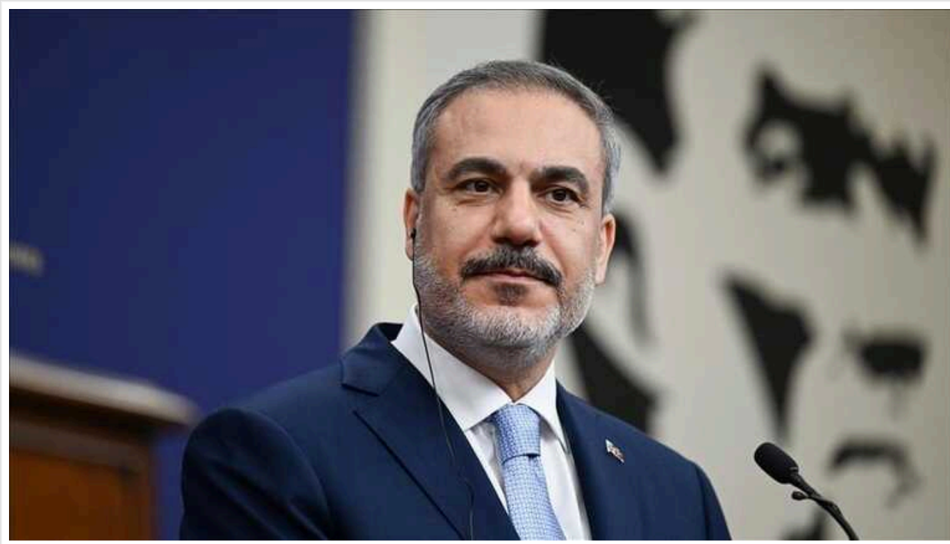
Глава МЗС Туреччини Хакан Фідан заявив, що не бачить фундаменту для врегулювання конфлікту в Україні цього року

"У 2024 році немає фундаменту для того, щоб очікувати на розвиток цього питання. Ми не бачимо цього в найближчому майбутньому".