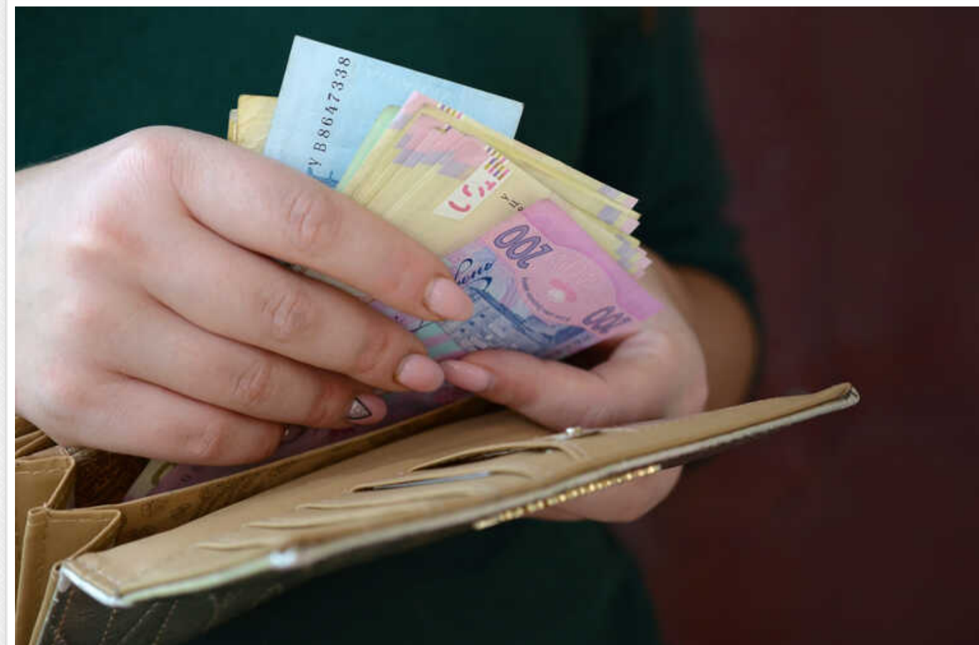
Прем'єр-міністр розповів, коли в Україні можуть збільшити виплати при народженні

Ідею про збільшення виплати допомоги при народженні дитини з поточних 41,28 тис. грн до понад 384 тисяч можуть відкласти. Причина – відсутність у країні необхідних для цього коштів, адже "кожна гривня, зароблена українським бюджетом, йде на підтримку Сил безпеки та оборони".