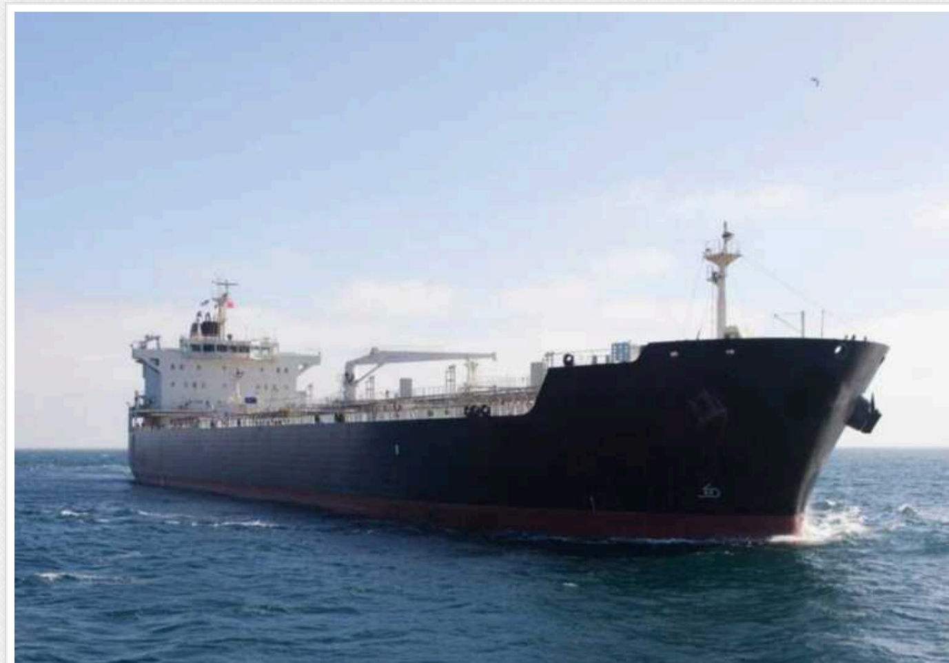
Vloomberg: Китай у цьому місяці наближається до рекордної кількості закупівлі російської нафти

Китай перебуває на шляху до імпорту у цьому місяці рекордної кількості російської нафти завдяки різкому збільшенню імпорту нафти сорту "Сокіл".