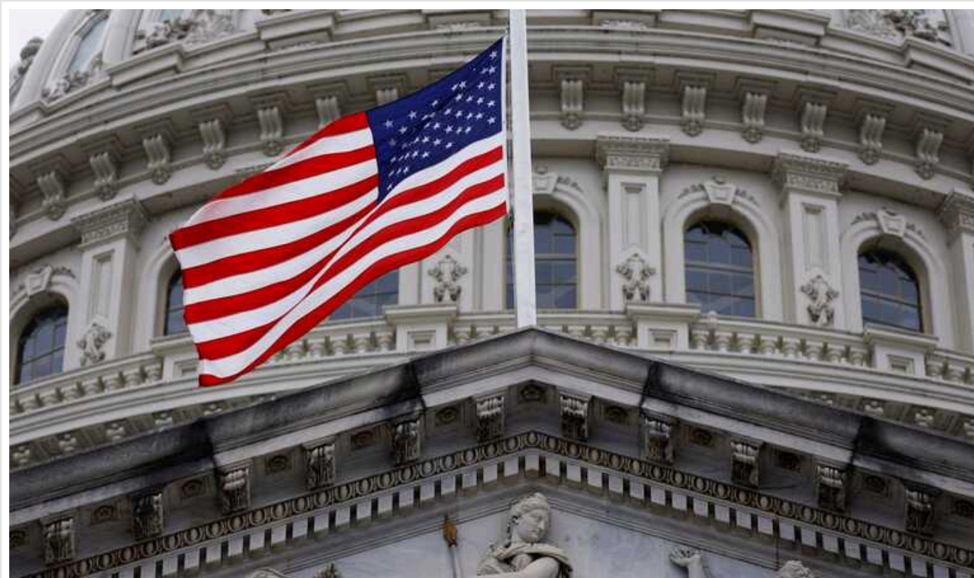
У Сенаті США впевнені, що з новою допомогою Україна зможе повільно відтіснити окупантів

Додаткове американське фінансування українських військ не призведе до кардинального прориву на полі бою, однак дасть змогу поступово відтіснити росіян.