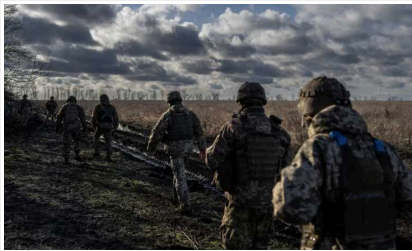
Лінія оборони Збройних сил України під Авдіївкою зміщується на захід

З такою оцінкою виступив військовий експерт Bild Юліан Рьопке.