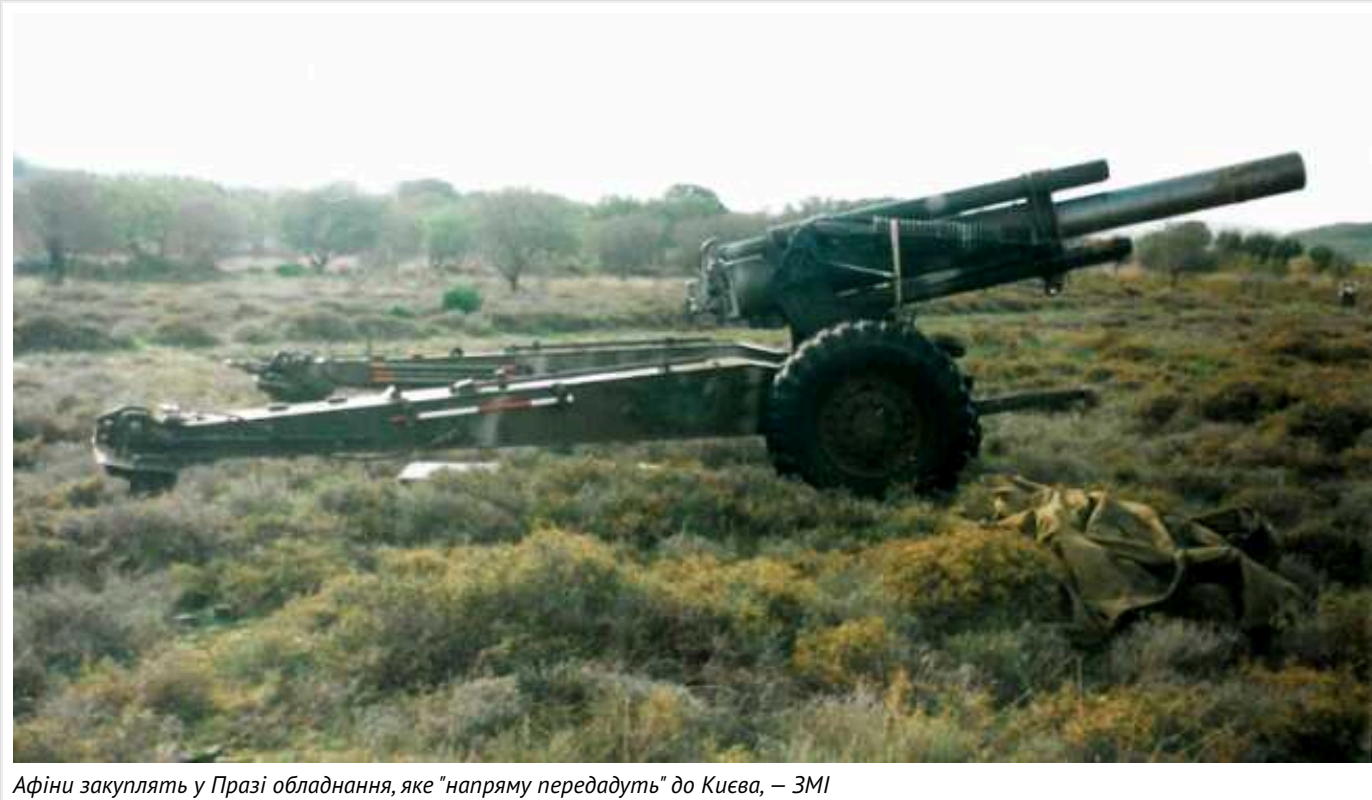
Афіни закуплять у Празі обладнання, яке "напряму передадуть" до Києва, – ЗМІ

Про це пише грецька газета Kathimerini .