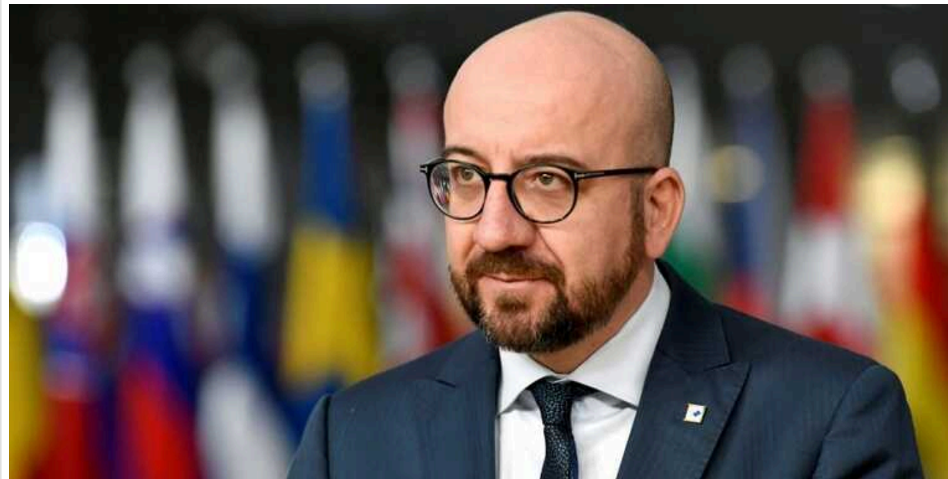
Шарль Мішель закликав Євросоюз готуватися до оборони та перейти в режим воєнної економіки

Європейському союзу потрібно надати Україні достатньо допомоги для того, щоб зупинити РФ. Європі необхідно підготуватися до оборони і перейти в режим воєнної економіки.