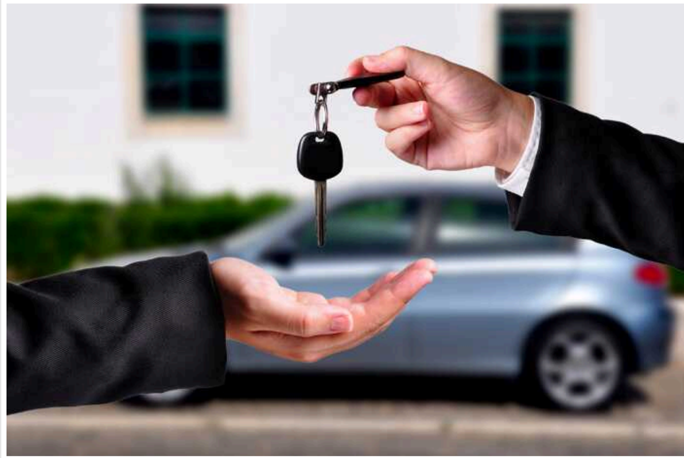
Подобається купувати авто, ремонтувати їх, та продавати: Дружина слідчого з Дніпра придбала 7 автівок за дуже низькими цінами, – ЗМІ

Старший слідчий Олександр Терьошин задекларував 7 автівок дружини-поліцейської, яка купила їх за 5, 45 та 49 тисяч гривень.