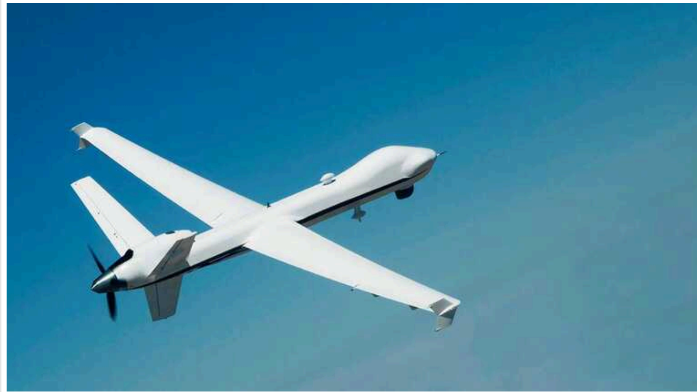
Україна може запускати по території Росії від 30 до 60 далекобійних БПЛА щоночі, - Рьопке

За його підрахунками, з початку року ЗСУ атакували безпілотниками 12 російських НПЗ, завдавши по них 17 ударів. Максимальна дальність ураження становила 900 км.