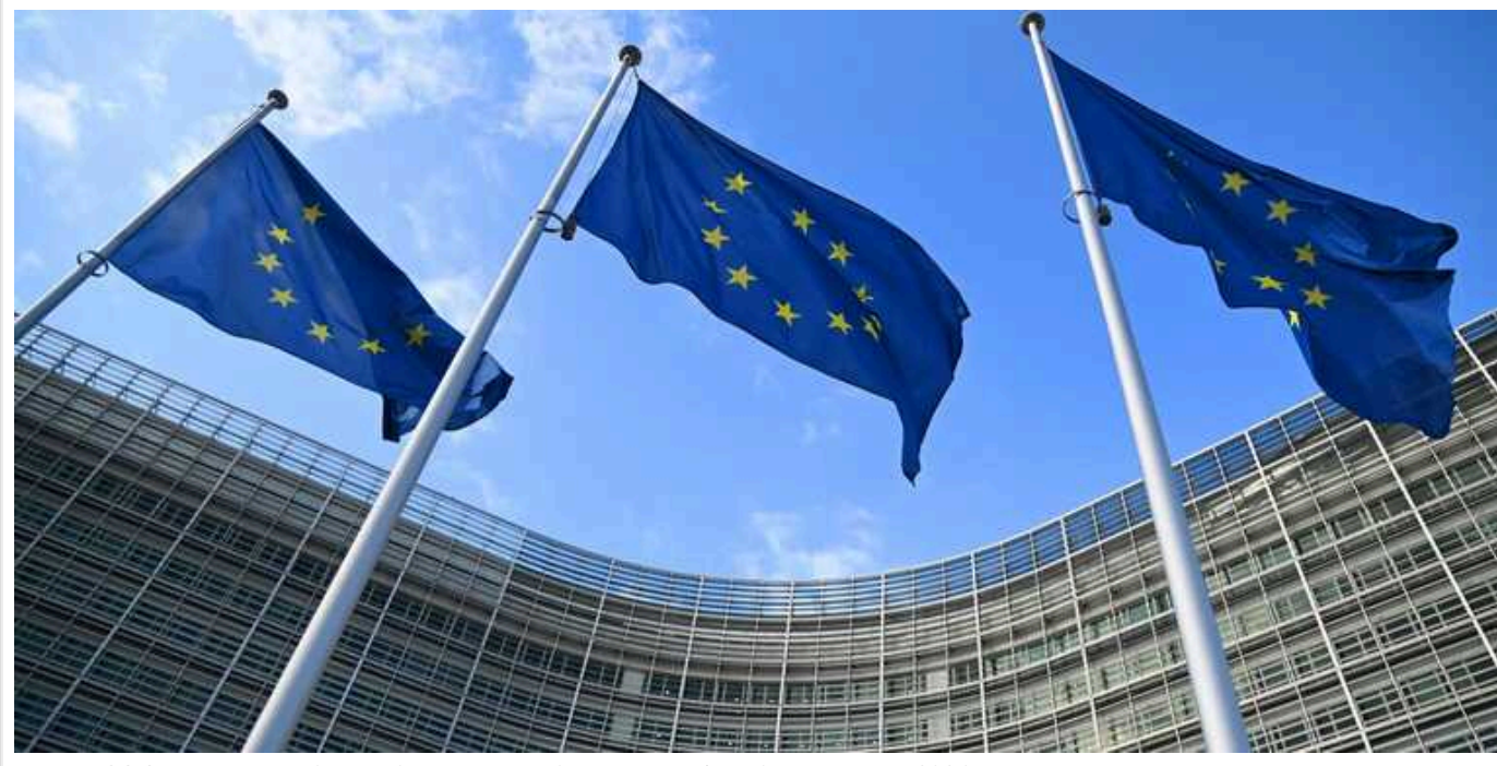
Глави МЗС Євросоюзу погодилися дати 5 мільярдів євро на зброю для України у 2024 році

Міністри закордонних справ країн Євросоюзу вирішили виділити додаткові 5 мільярдів євро на військову підтримку України в межах Європейського фонду миру.