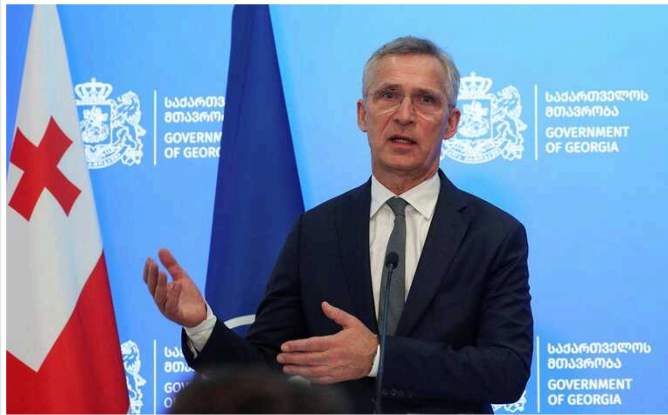
Ситуація на фронті в Україні складна, союзники по НАТО передають 99% допомоги, - Столтенберг

На полі бою в Україні продовжує залишатись складна ситуація. Союзники по НАТО передають 99% всієї військової допомоги.