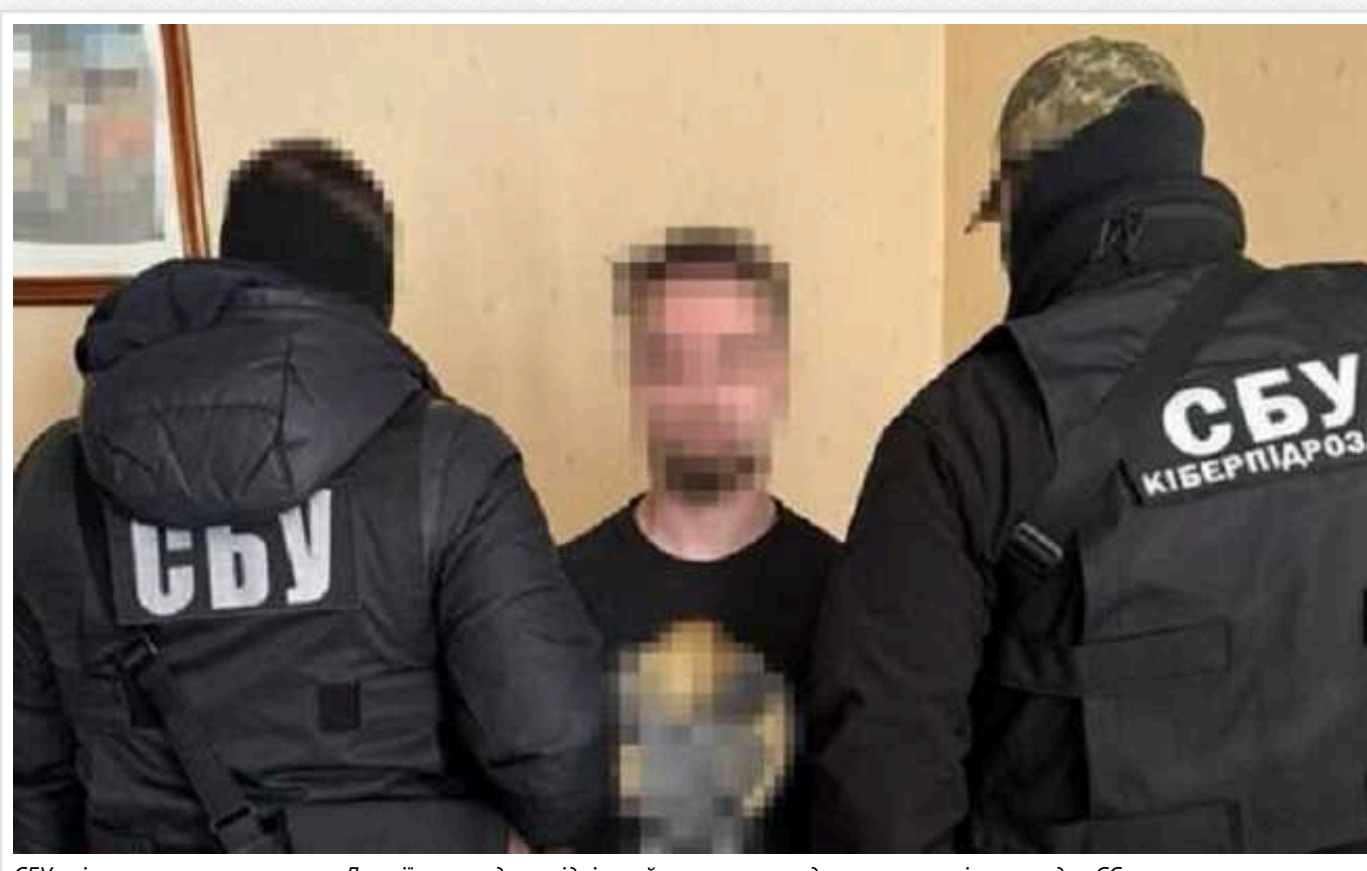
СБУ спільно з правоохоронцями Латвії знешкодили підпільний кол-центр: видурювали гроші у громадян ЄС

СБУ спільно з правоохоронцями Латвії знешкодила підпільний кол-центр, який видурював гроші у громадян ЄС