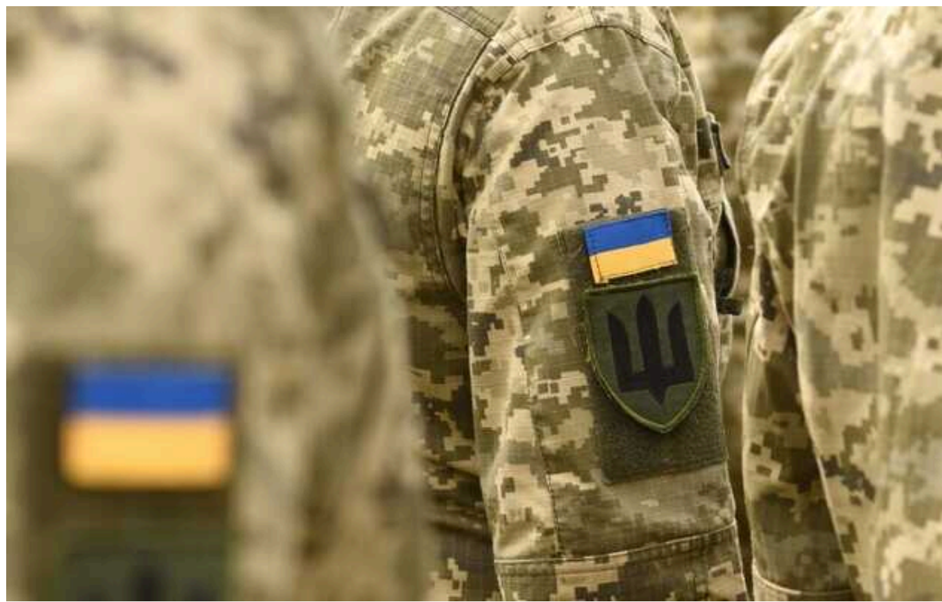
На Тернопільщині чоловік проігнорував повістку й отримав вирок суду

Житель Тернопільської області отримав три роки за ґратами за ухилення від мобілізації. Чоловік пояснив, що військово-лікарська комісія визнала його придатним, незважаючи на проблеми зі здоров'ям; окрім того, він "морально не готовий до проходження служби і не готовий вбивати, а також не вміє користуватися зброєю".