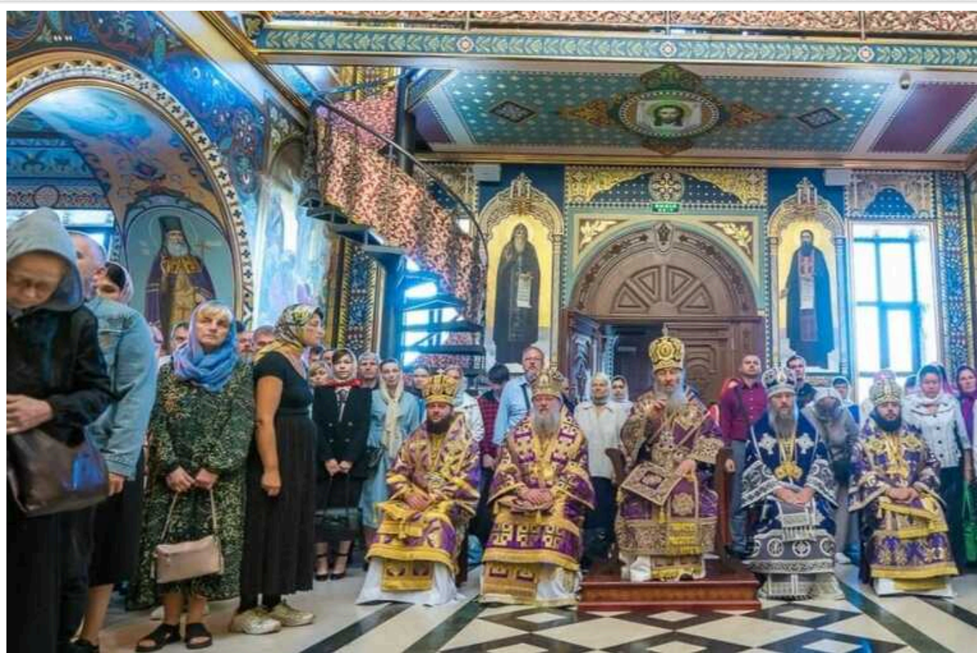
Лобіст Новинського погрожує нардепам, які хочуть заборонити Московську церкву в Україні

У п'ятницю, 15 березня, керівники українського парламенту Руслан Стефанчук, Олександр Корнієнко й Олена Кондратюк та всі депутати Верховної Ради отримали листа з погрозами від юридичної компанії "Амстердам та партнери".