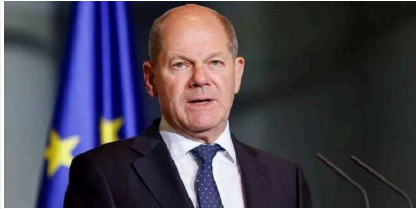
Шольц вважає, що напад Ізраїлю на Рафах ускладнить мир у регіоні

Канцлер Німеччини Олаф Шольц висловився про "страшно високу ціну" наступу Ізраїлю на угруповання ХАМАС у Газі. Він заявив, що світ не може стояти осторонь та спостерігати, як палестинцям загрожує голодна смерть в анклаві.