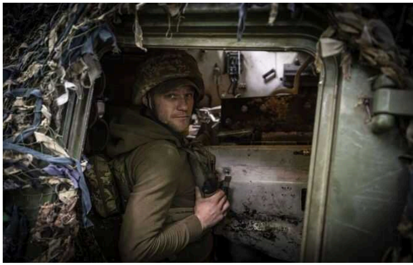
Ситуація на фронті: ворог продовжує активні штурми у Донецькій області

В Україні на фронті протягом доби сталося 72 бойових зіткнення. Ворог продовжує активні штурми на Донеччині.