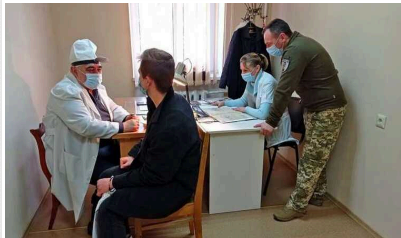
Військові можуть оскаржити рішення ВЛК

Українські військові можуть оскаржити рішення військово-лікарської комісії, якщо вони не згодні з висновком.