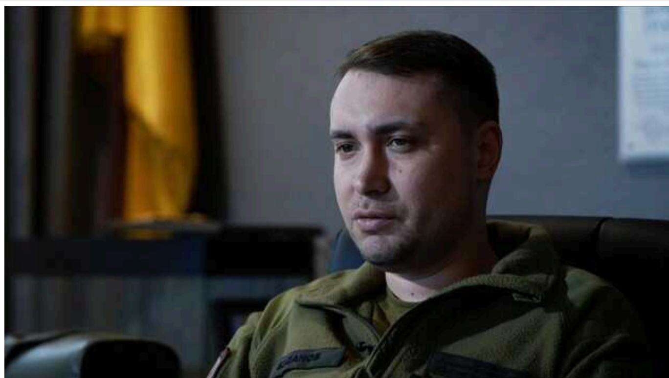
Ми повинні використати слабкість Путіна і зробити її додатковою зброєю, - Буданов

Російський диктатор Володимир Путін на тлі триваючого рейду добровольців у прикордонні області, інцидентів на виборчих дільницях під час псевдовиборів та зростання сумнівів щодо легітимності демонструє світовим лідерам свою слабкість. Україна має це використовувати у боротьбі з агресором.