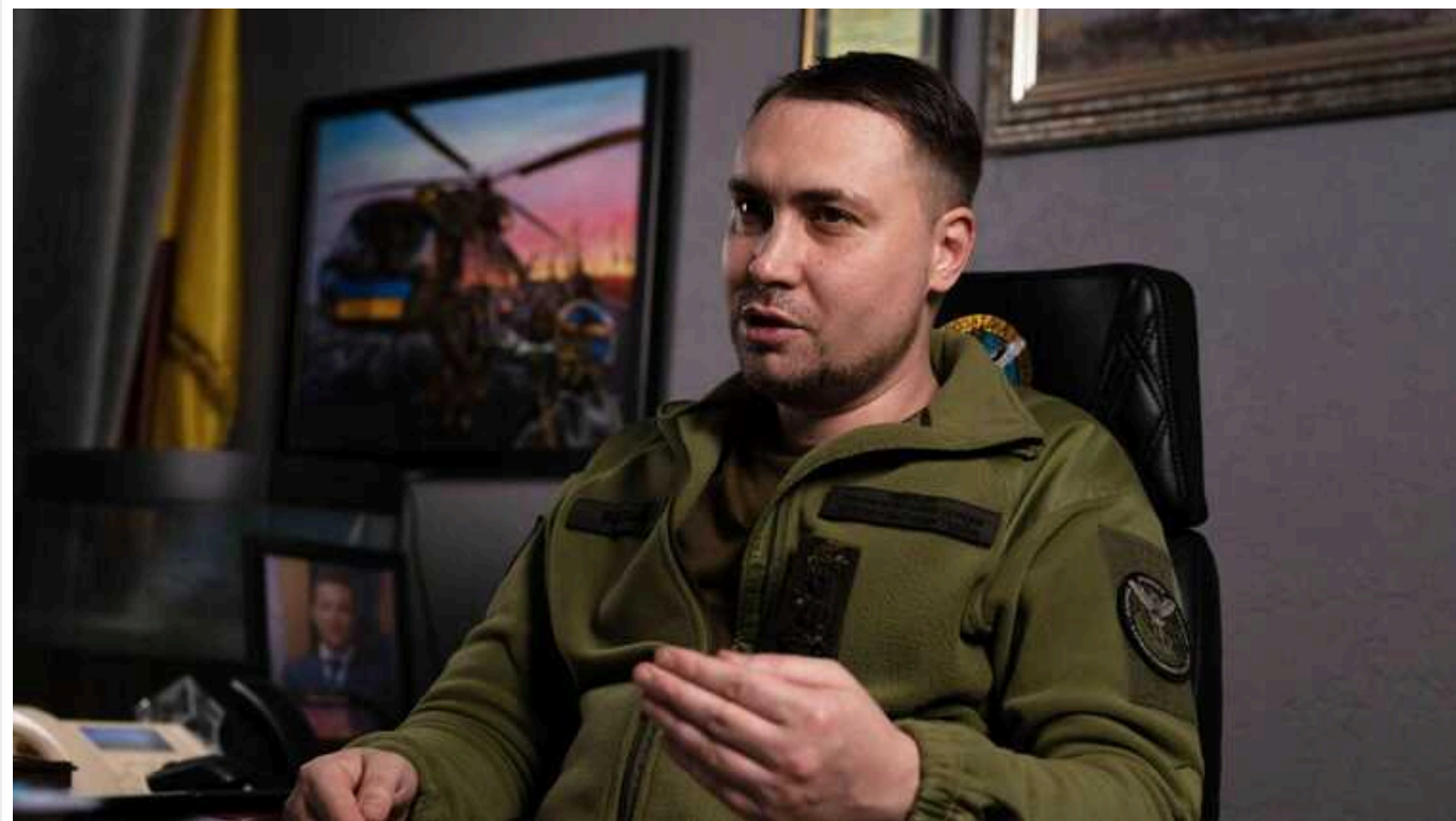
Буданов назвав головну мету російських повстанців

Начальник Головного управління розвідки Міноборони Кирило Буданов відзначив внесок російських добровольців у справу захисту України від путінської збройної агресії.