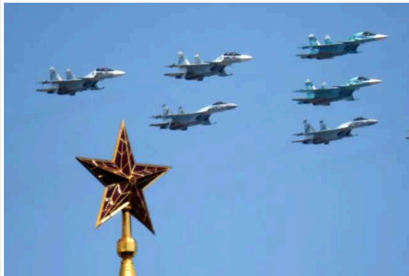
Удари РФ по Британії: розвідники назвали перші дев'ять цілей ПКС РФ

Переданий російським агентом документ розкриває подробиці, з яких аеродромів злетять бомбардувальники. Два пункти на півдні Англії опинилися в зоні підвищеного ризику.