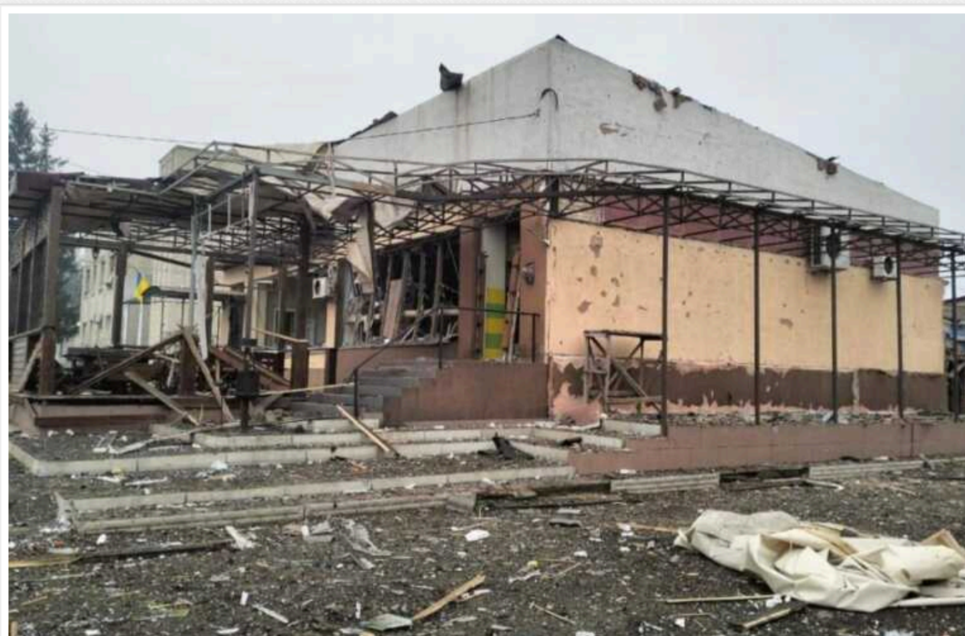
На Сумщині розпочалася масова евакуація

Російські окупанти щодня обстрілюють населені пункти на Сумщині. Ворог закидає українську територію КАБами, артилерійськими, балістикою, мінами та ракетами. В Оперативному командуванні "Північ" зазначили, що лише за добу на території Чернігівської та Сумської областей пролунало майже 500 вибухів. Найбільше обстрілів було на Сумщині.