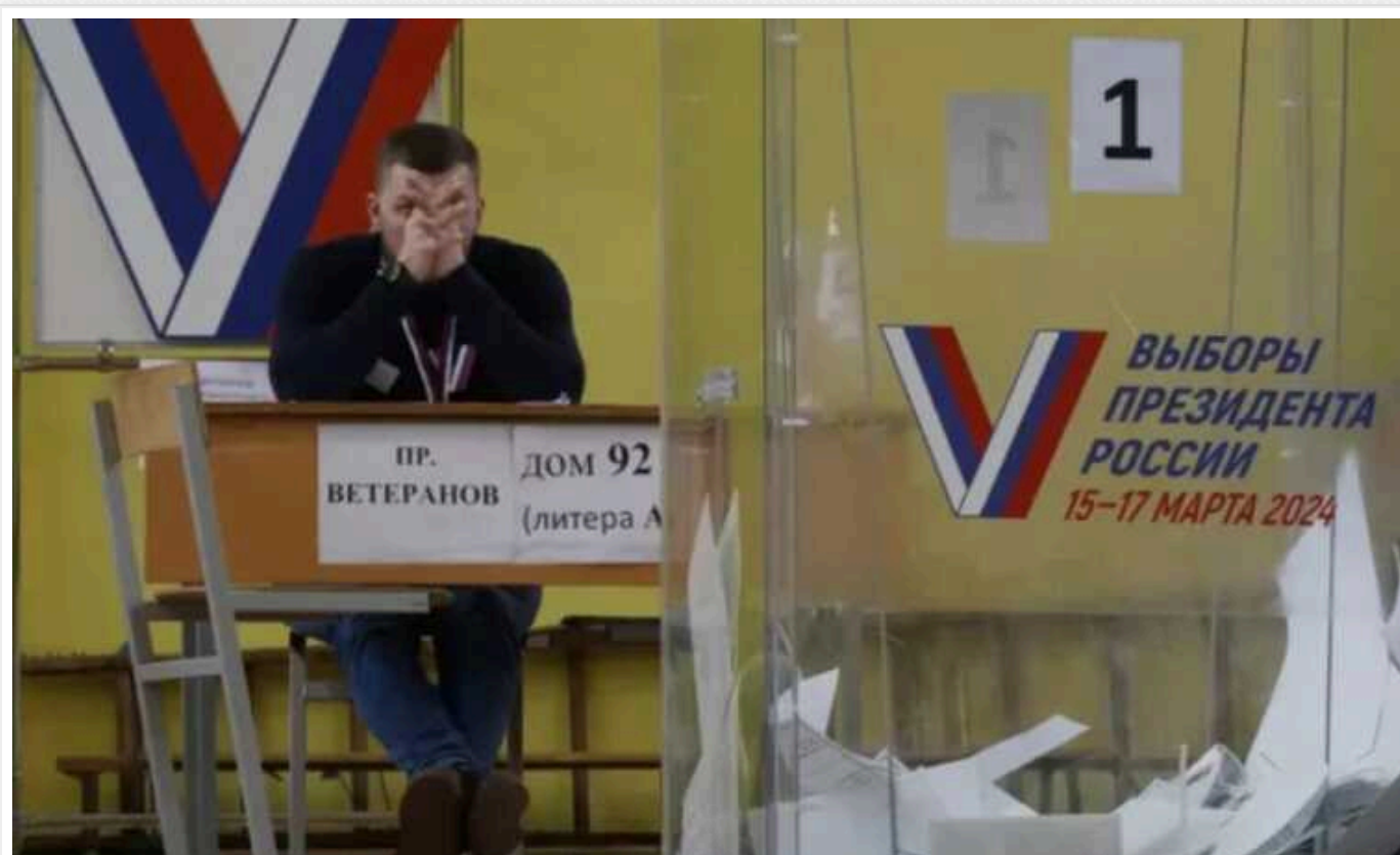
Як світ відреагував на вибори Путіна в Росії

Володимир Зеленський очолив список світових лідерів, які висловилися з приводу президентських виборів у РФ. Судячи з попередніх даних, Путін здобув неймовірно переконливу "перемогу".