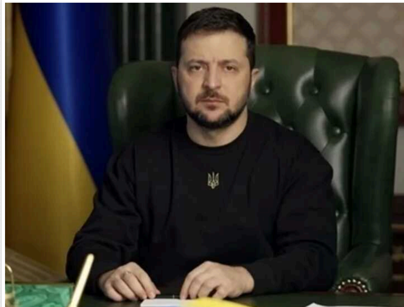
Зеленський відзначає захисників, які роблять неможливе на фронті

Президент України Володимир Зеленський відзначив підрозділи та конкретних військових, які найкраще відзначилися на фронті. Глава держави подякував за силу та ефективне знищення окупанта.