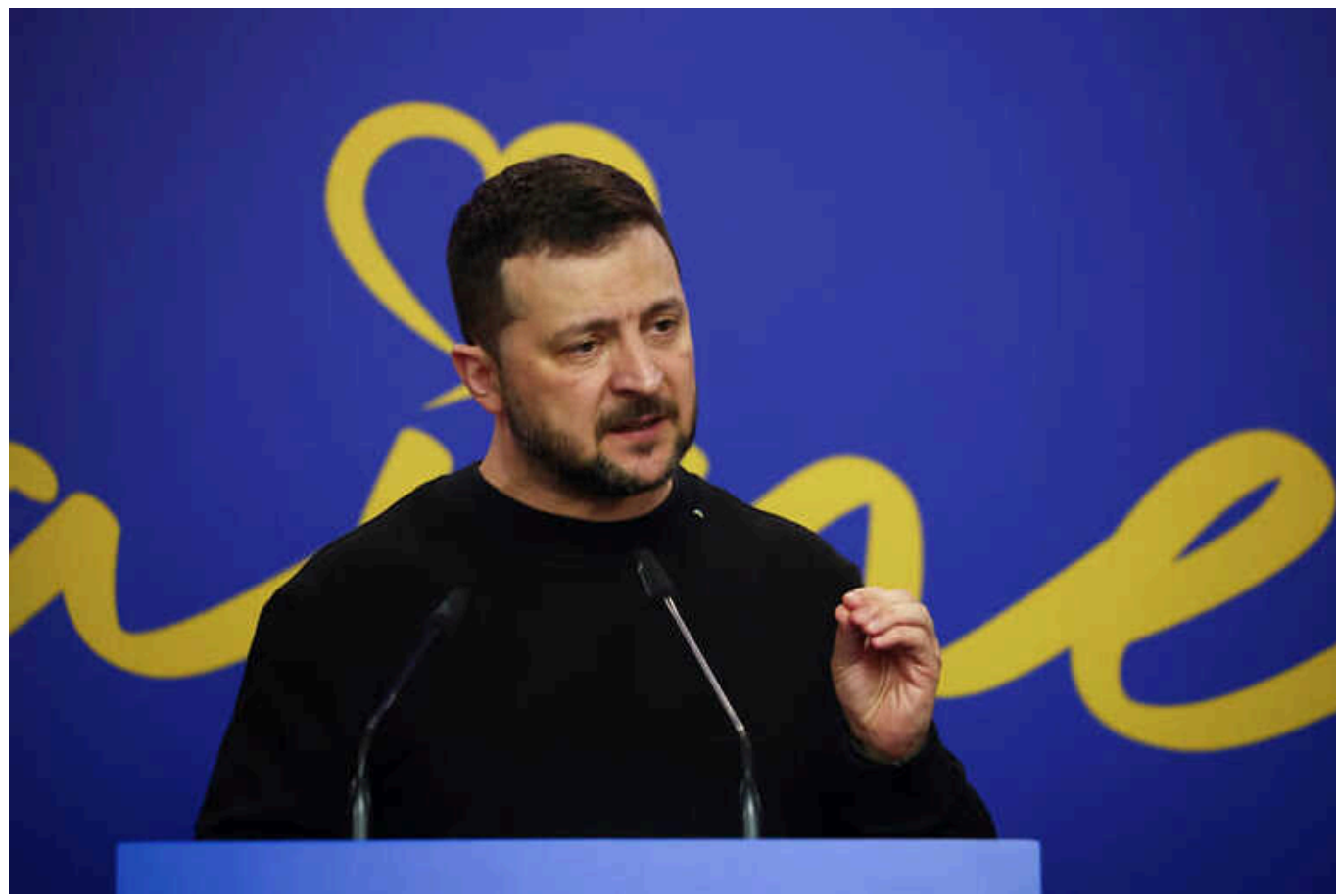
Зеленський прокоментував президентські псевдовибори в РФ

Володимир Зеленський прокоментував фейкові вибори президента у Росії та на тимчасово окупованих територіях.