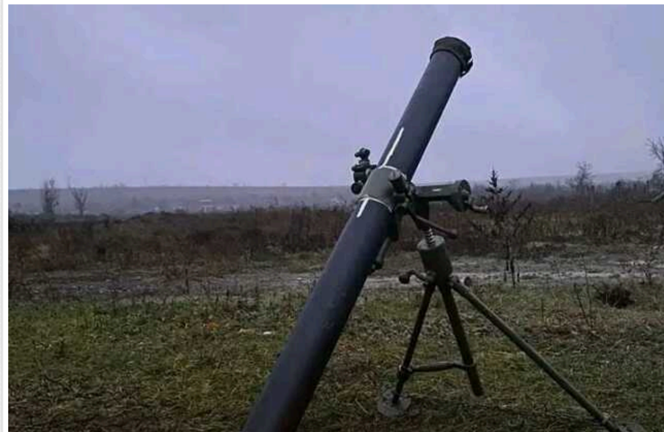
Загарбник випарувався після прямого влучення міни калібром 82 міліметри

Мінометники 93-ї ОМБР "Холодний Яр" влучили в окупанта, який перебував в окопі на бахмутському напрямку.