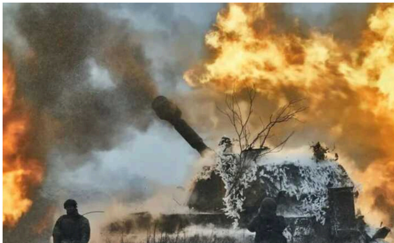
ISW: Війська РФ замінили піхотні "м'ясні штурми" атаками бронетехніки та просунулися за Авдіївкою

Окупаційні війська Росії вдаються до нововведень на Авдіївському напрямку, замінюючи класичні піхотні "м'ясні штурми" атаками з використанням бронетехніки, щоб посилити та підтримувати постійний тиск на ЗСУ. Так вони просунулися в цьому районі, нібито захопивши села Тоненьке та Невельське.