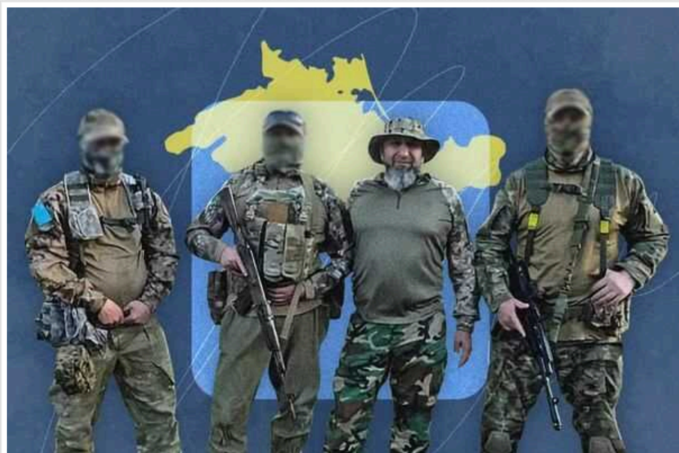
10 років спротиву кримських татар російським окупантам : «Для нас це священна війна»

1230 років — такий загальний термін ув'язнення для понад сотні репресованих росіянами у Криму від 2014 року. Переслідування тривають і далі.