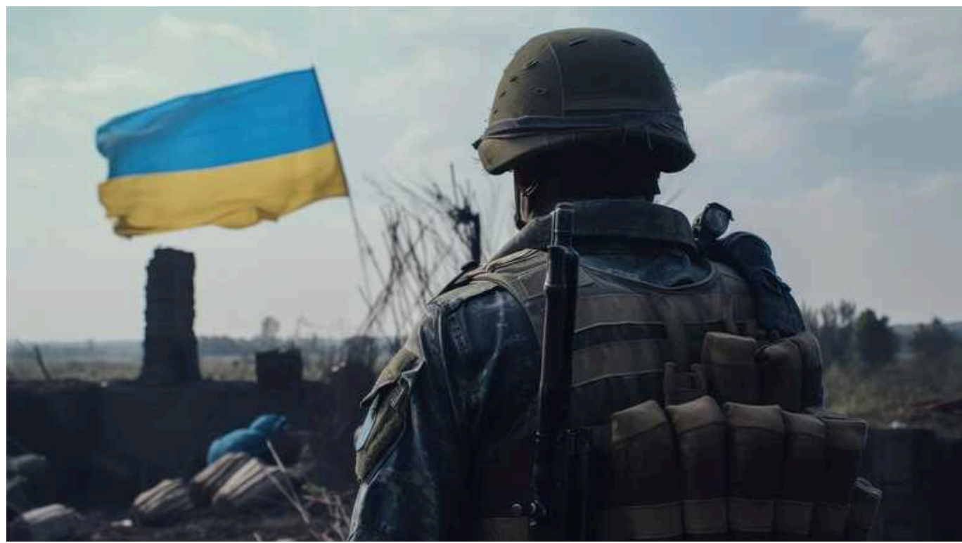
Ситуація на фронті: на Новопавлівському напрямку ВСУ відбили 25 російських атак

За минулу добу найбільше російських штурмів зафіксовано на Новопавлівському напрямку - 25. Загалом Сили оборони відбили 63 атаки армії РФ.