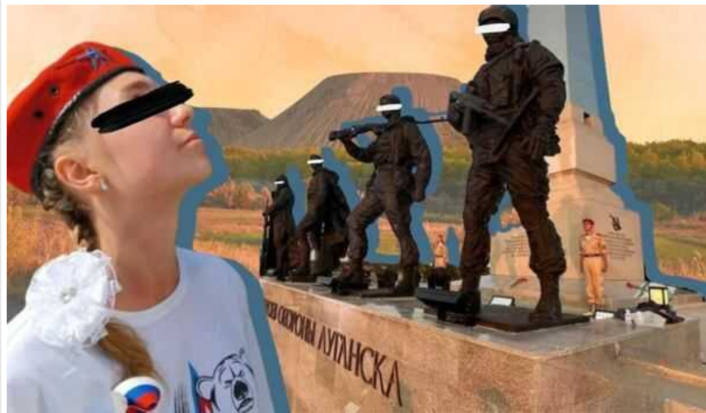
Що Україна отримає після звільнення тимчасово окупованих територій Донбасу

Перемога для українців – це повернення під український прапор земель і людей, які від 2014-го опинилися під російською окупацією. Ми прагнемо цього. Та мало хто задумується, якими держава Україна одержить ці території. З якими викликами суспільству доведеться зіткнутися після звільнення сходу?