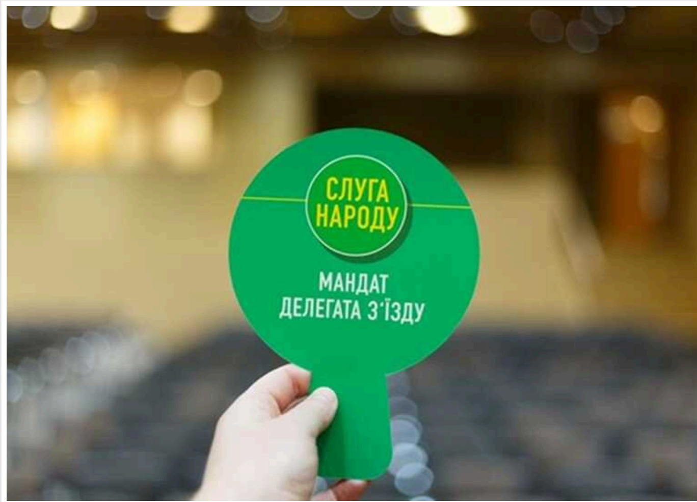
«Пройшла невдало»: Після зустрічі Зеленського з фракцією «Слуги Народу» у них спало натхнення голосувати, – нардеп Гончаренко

Володимиру Зеленському не вдалося підбадьорити «слуг народу» під час зустрічі, констатував Олексій Гончаренко