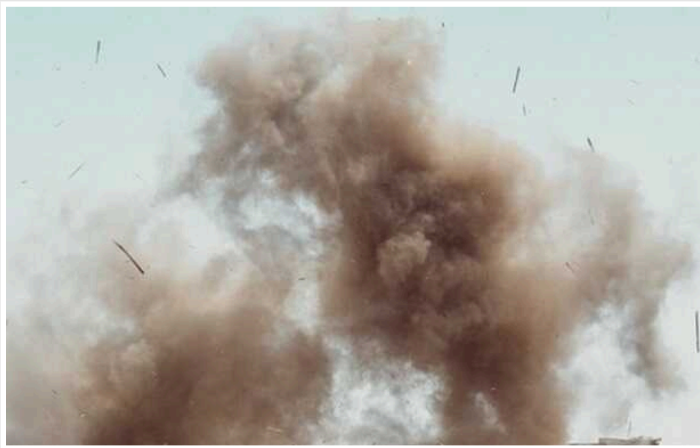
Окупанти завдали ударів по інфраструктурі Сум