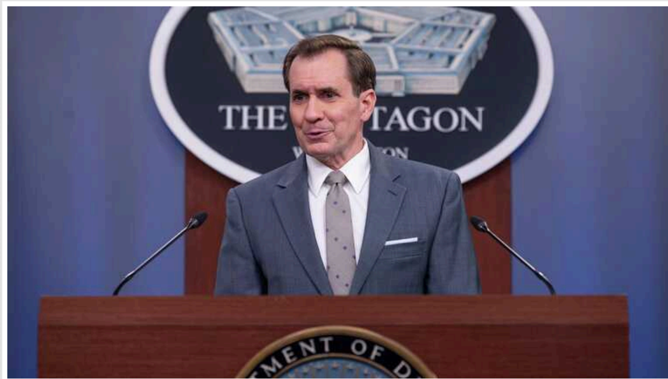
У Білому домі заявили, що в Україні закінчуються боєприпаси на Донбасі

Координатор стратегічних комунікацій у Раді нацбезпеки Білого дому Джон Кірбі заявив, що в Україні закінчуються боєприпаси на Донбасі.