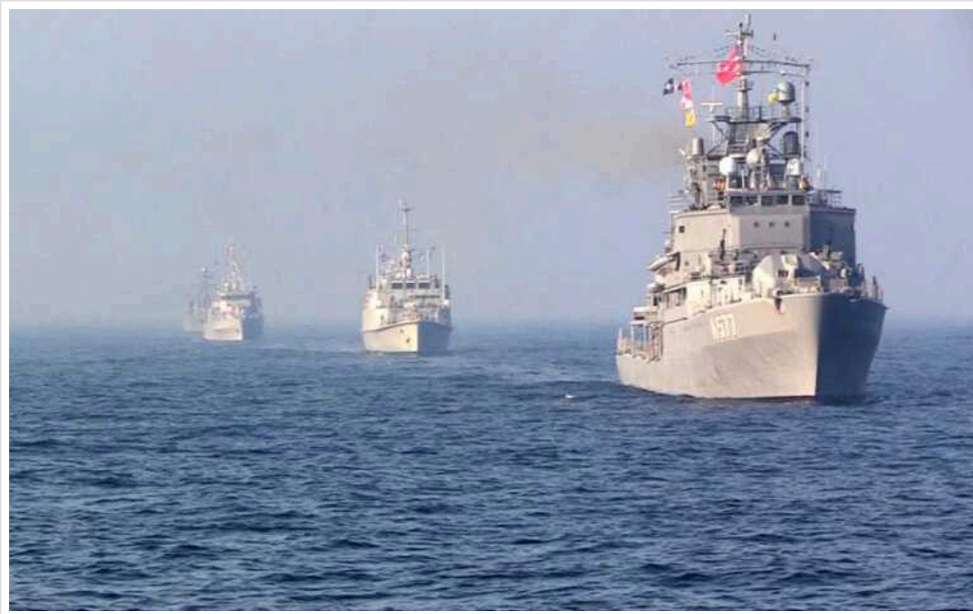
Україна перехопила ініціативу у Чорному морі, РФ шукає вихід, – представник ВМФ ЗСУ

Українські війська перехопили ініціативу у Чорному морі, чим змусили Чорноморський флот РФ сховати свої кораблі у пунктах базування. Ворог вже тривалий час не виводить в акваторії Чорного та Азовського морів свої кораблі.