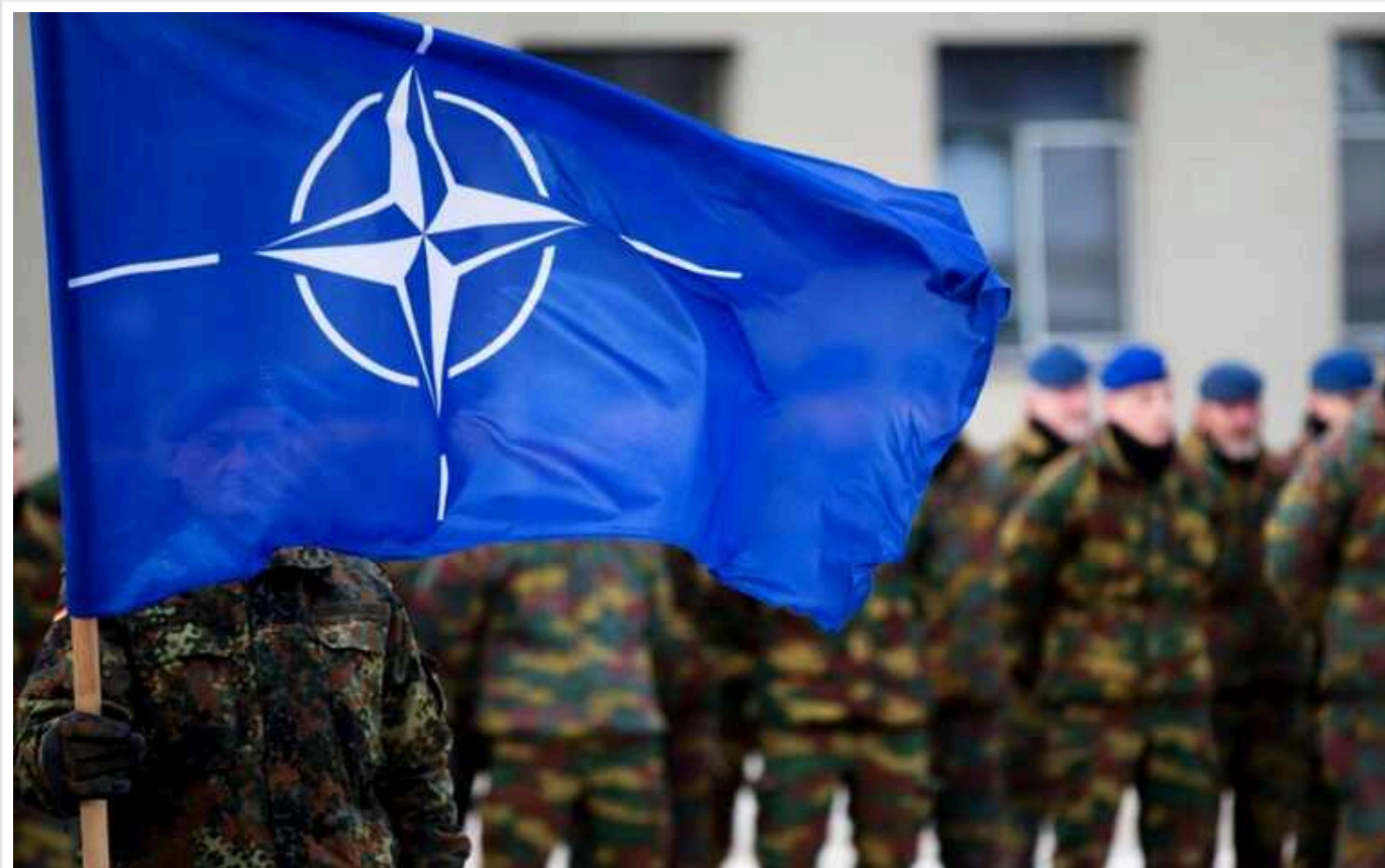
Європейським членам НАТО не вистачає 56 мільярдів євро, щоб виконати цільовий показник витрат на оборону, – Financial Times

Згідно з дослідженням, такі країни ЄС як Італія, Іспанія, Бельгія не можуть досягти встановлених НАТО показників оборонних витрат на рівні 2% від ВВП, при цьому вони мають одні з найвищих показників державного боргу та бюджетного дефіциту.