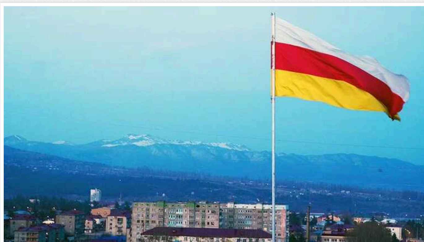
Південна Осетія прагне ввійти до складу Росії