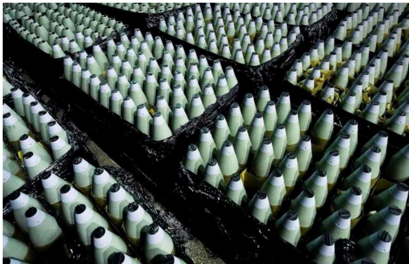
WSJ: Чехія тихо «полює» за снарядами для України, що не вдається навіть США

Україна ось-ось отримає великі партії боєприпасів, за які бореться Чехія – колишня радянська держава-сателіт, одна із найпалкіших прихильників України.