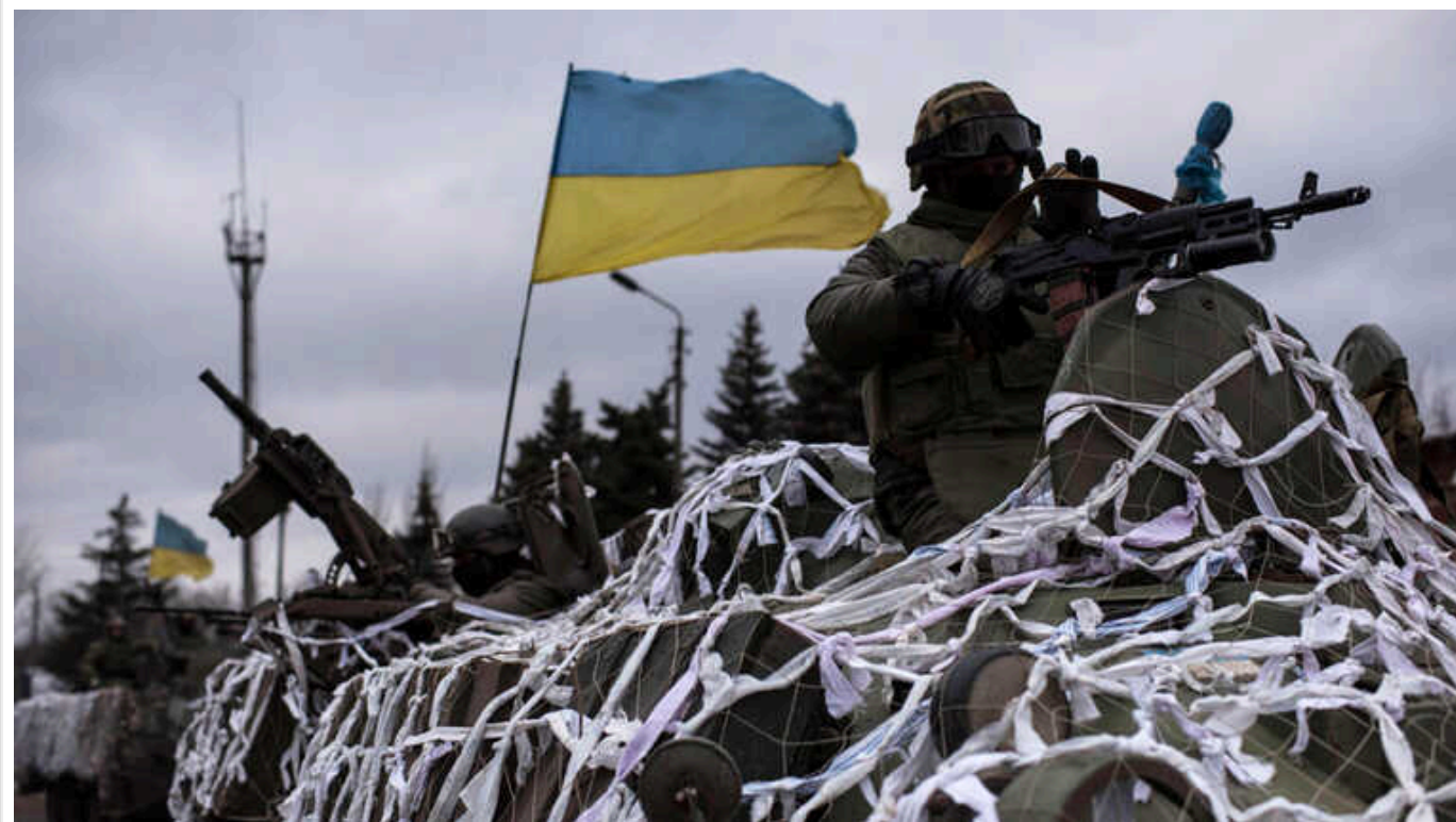
Велика Британія радить Україні тримати оборону на сході і зосередитися на ударах по Криму, – ЗМІ

Міністр оборони Великої Британії Грант Шаппс і командувач британської армії Тоні Радакін під час візиту в Україну дали поради вищому керівництву і військовим командувачам щодо стратегії у війні проти РФ.