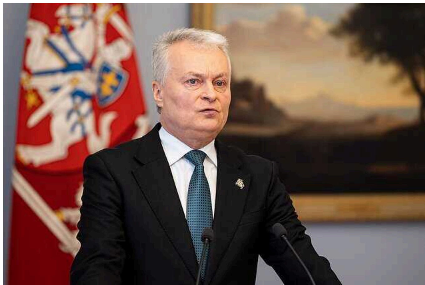
Президент Литви заявив про емоційну нестабільність уряду на тлі відставки міністра оборони

Президент Литви Гітанас Науседа заявив, що у нього викликає тривогу помітна останнім часом емоційна нестабільність уряду.