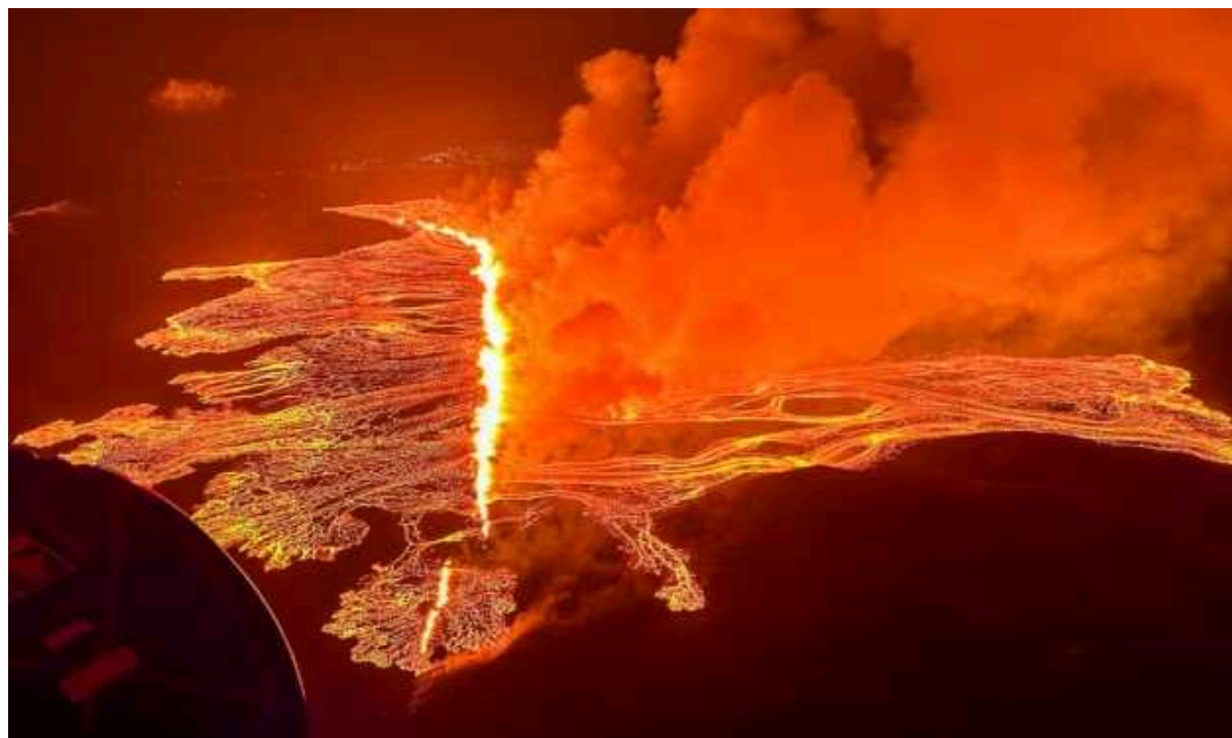
За останні три місяці в Ісландії вчетверте почалось виверження вулкана

В Ісландії напередодні увечері почалось виверження вулкана, яке стало четвертим за останні три місяці.