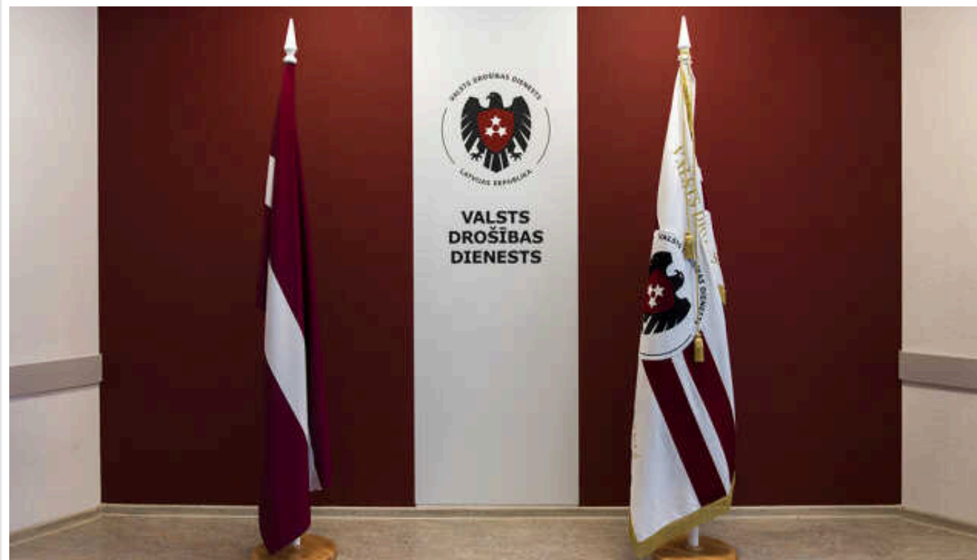
Латвія почала провадження проти євродепутатки, яку підозрюють у роботі на російській спецслужбі

Служба державної безпеки Латвії порушила кримінальну справу проти депутатки Європарламенту Тат'яни Жданок, яку підозрюють у співпраці з російськими спецслужбами.