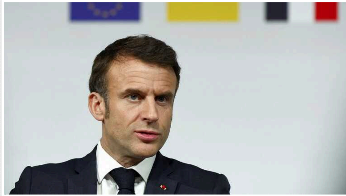
"Ми маємо підготуватися до всіх сценаріїв", - Макрон про Україну

Президент Франції Еммануель Макрон заявив, що "ми маємо підготуватися до всіх сценаріїв" по Україні.