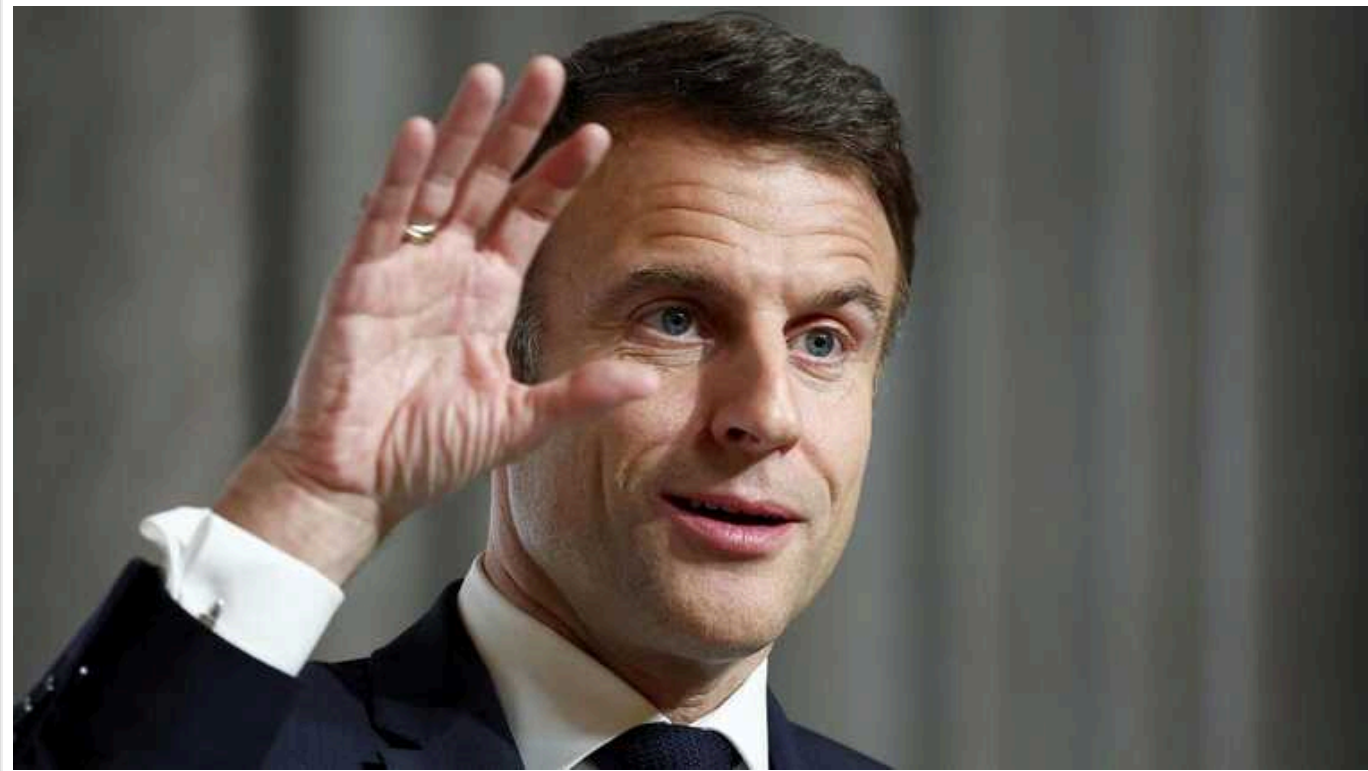
Макрон пояснив, як змінив особисте ставлення до Путіна: "У нас лімітів немає"

Лідер Франції підкреслив, що дійшов нових висновків у стратегічній позиції.