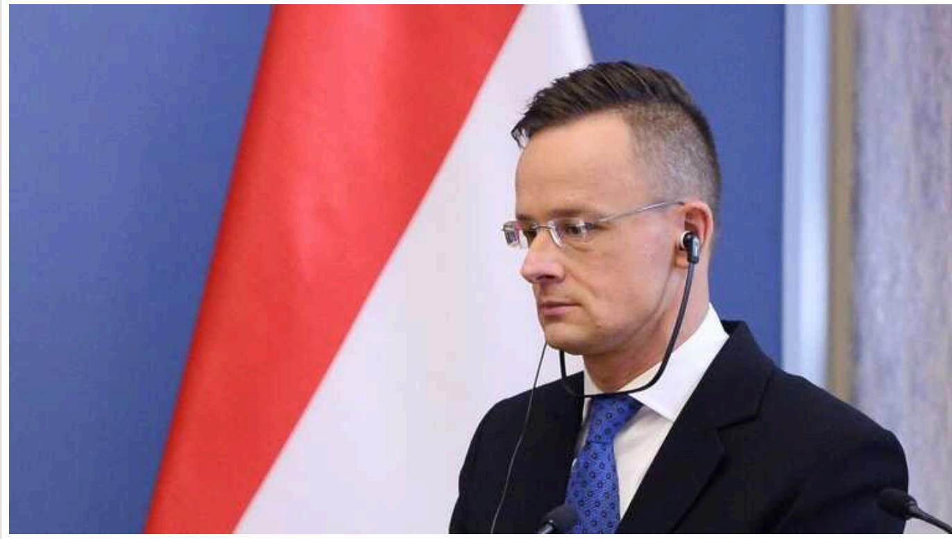
Сійярто заявив, що Угорщина не підтримає кандидата Нідерландів на посаду генсека НАТО

Міністр закордонних справ Угорщини Петер Сійярто вкотре повторив, що офіційний Будапешт не підтримує обрання нідерландця Марка Рютте наступним генеральним секретарем НАТО. Водночас порадів за те, що на цю посаду нарешті з'явився кандидат від Центральної Європи.