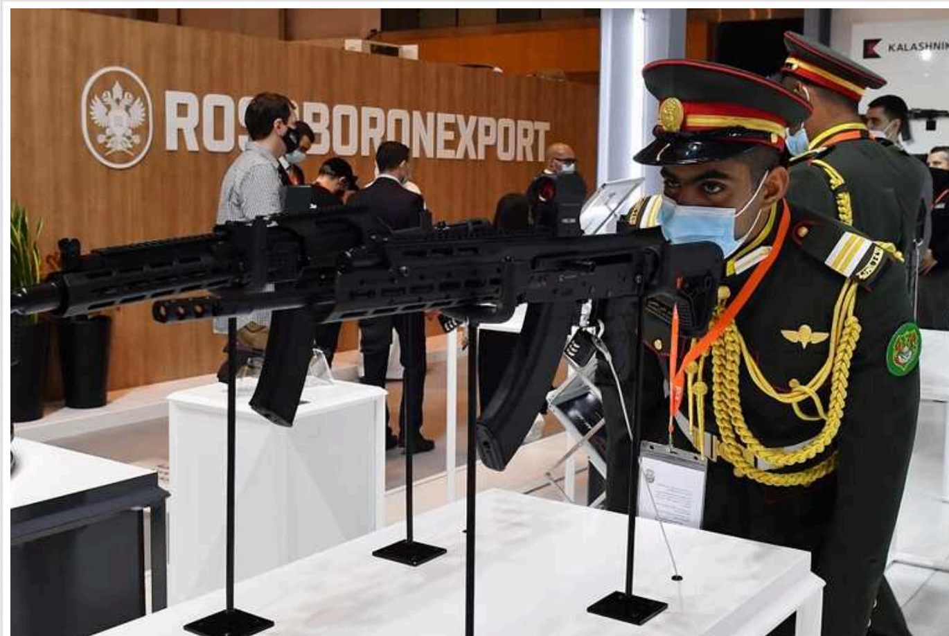
У розвідці Британії пояснили, чому в Росії з 2014 року у півтора рази впав експорт зброї

Упродовж останніх десяти років російський експорт зброї впав на 53%. Ймовірно, це пов'язано з регулярними втратами на полі бою і не лише.